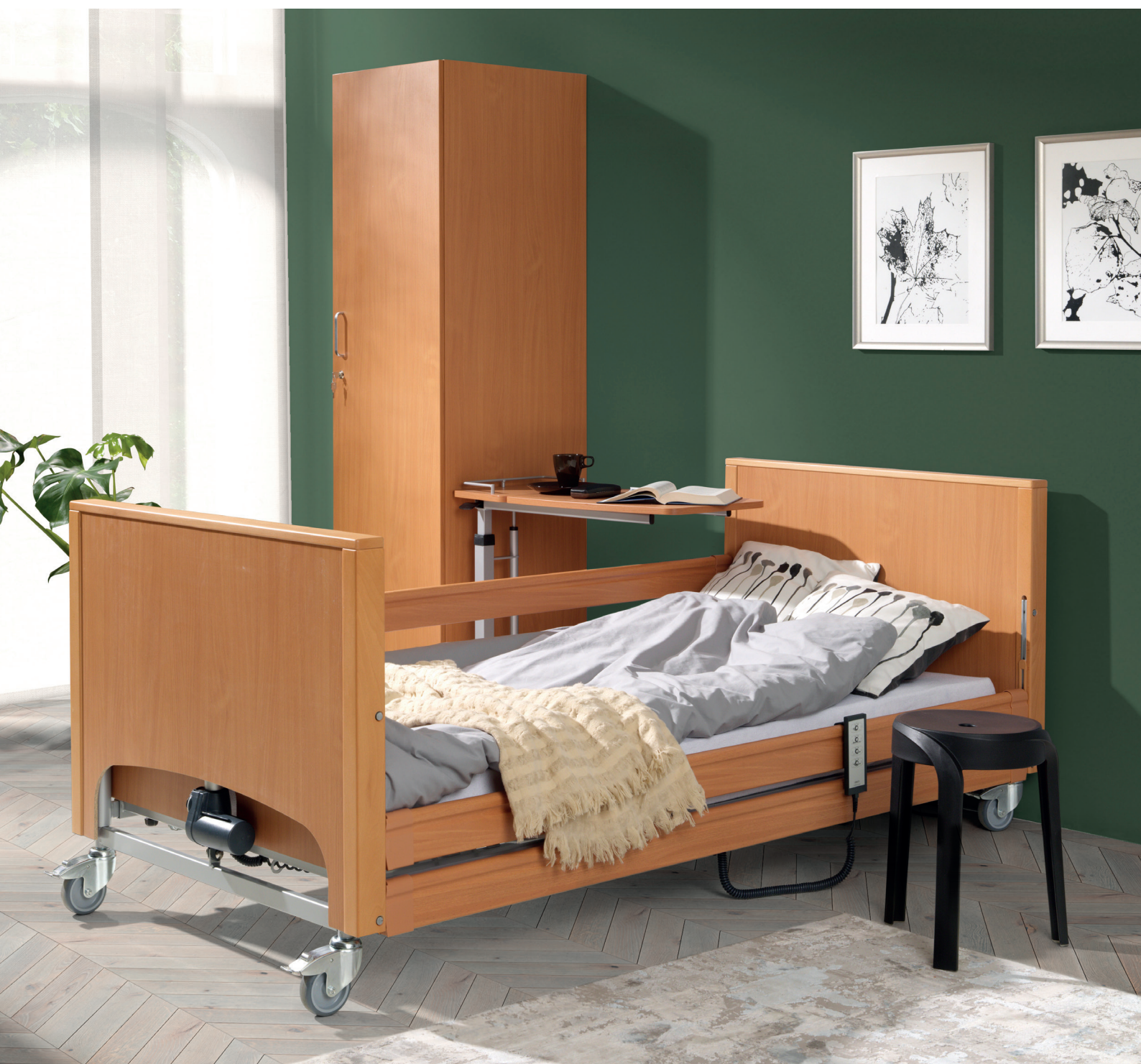
Bild: PB 337 Standardausführung, Holzdekor: Buche. Zubehör: Betttisch Rubens 3, Holzdekor: Buche.

Das PB 337 ist ein spezielles Pflegebett, das im Gegensatz zu klassischen Betten die Möglichkeit hat, die Liegefläche auf ca. 23 cm zu senken. Die niedrige, untere Liegeposition erleichtert den Zugang für Personen mit Koordinationsproblemen und erhöht die Patientensicherheit auch bei abgesenkten Seitengittern.