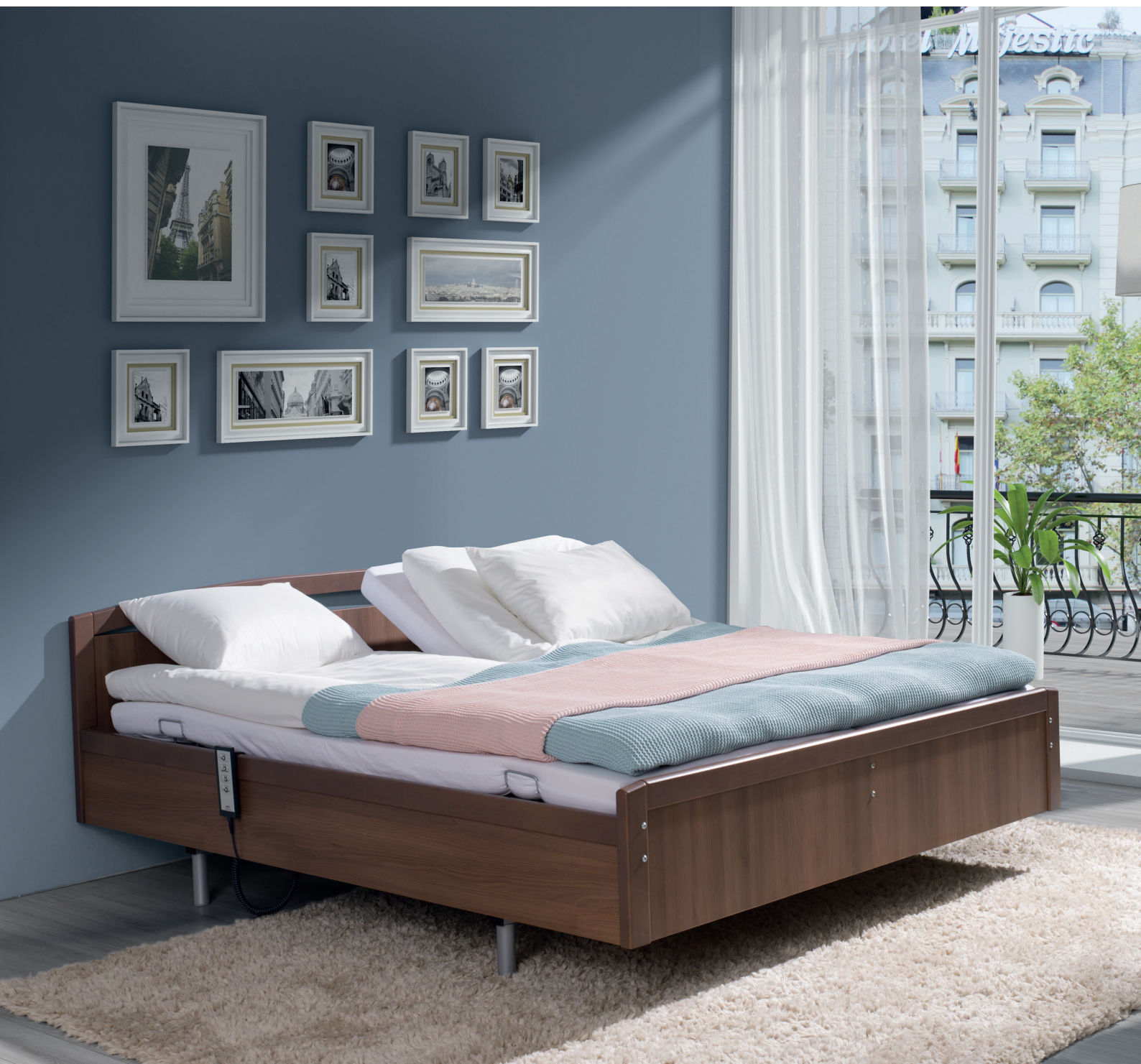
Holzumbau PB 533 DB mit zwei Einlegerahmen PB 521. Holzdekor: Walnuss

Der PB 533 DB Bettrahmen zusammen mit dem Einlegerahmen PB 521 ist unser Vorschlag für eine Lösung, die es beiden Partnern ermöglicht, das Bett zu benutzen, während alle wichtigen Funktionen erhalten bleiben. Dieses einzigartige Bett ermöglicht die ständige Unterstützung und Anwesenheit der Pflegeperson/des Partners, was ein wichtiger Faktor für die Genesung und Pflege des Patienten ist.