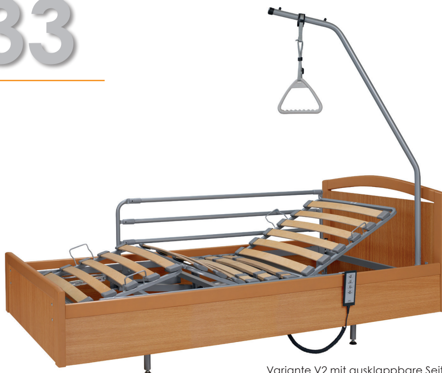
Variante V2 mit ausklappbare Seitengitter, Holzdekor: Buche