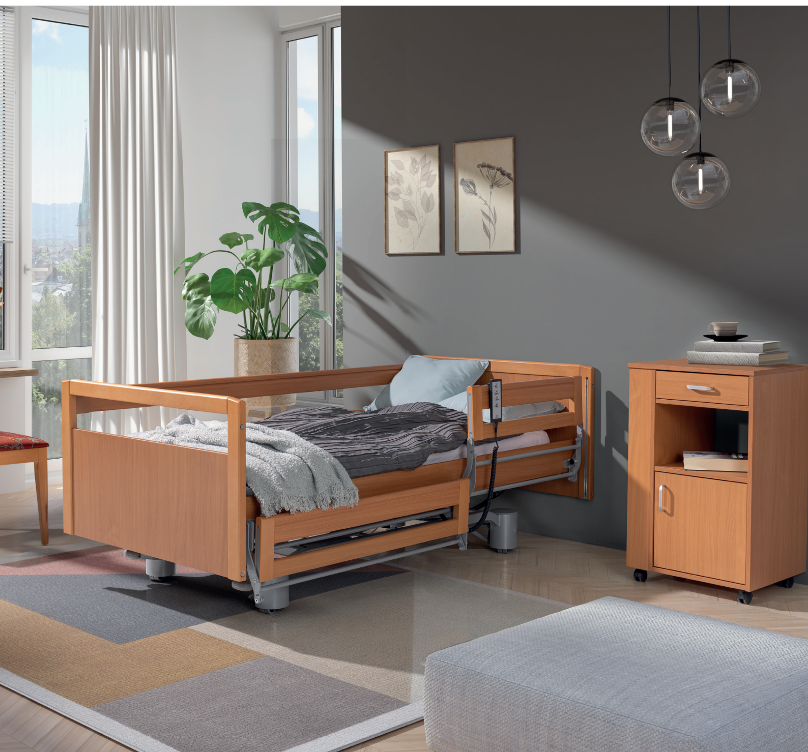
PB 536 mit geteilten Seitengittern einseitig, Holzdekor: Buche. Zubehör: Nachtschrank Rubens 1, Holzdekor: Buche

Modernes Design und Multifunktionalität sind die dominierenden Merkmale des Elbur PB 536. Erhöhte Arbeitsbelastung auf 200 kg, verkleidete Rollen und eine zentrale Bremse, die die Arbeit des Personals erleichtert, sind bewährte Lösungen, die in vielen Pflegeheimen zum Einsatz kommen und von anspruchsvollen Privatkunden zunehmend bevorzugt werden.