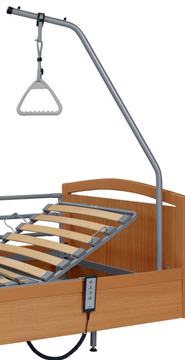
Wersja obudowy V2 w kolorze buk z barierką składaną