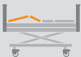
REGULACJA SEGMENTU NÓG