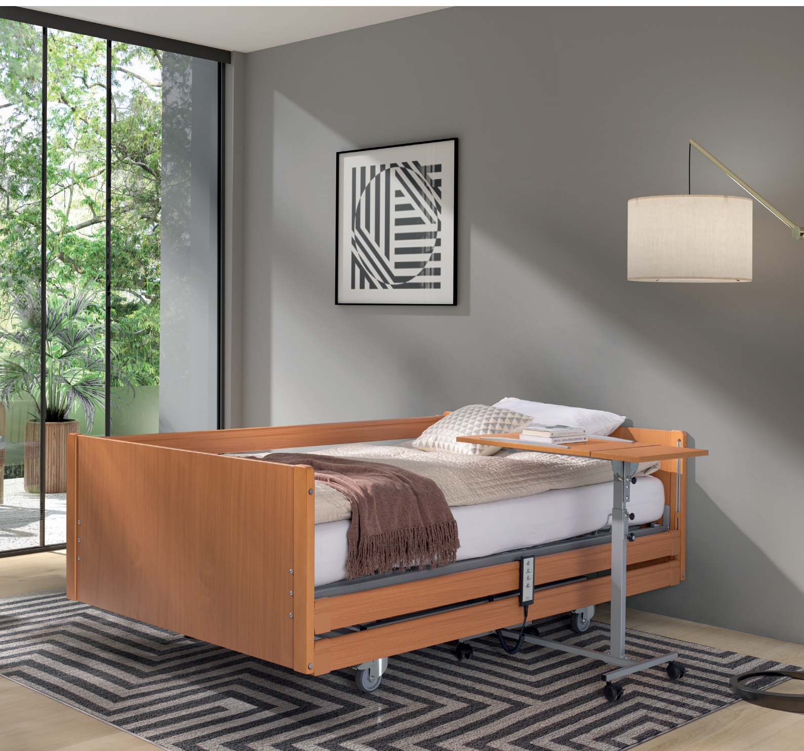
Na zdjęciu: łóżko PB X4 w kolorze buk w wykonaniu standardowym. Akcesoria: Stolik Rubens 9 w kolorze buk.

Dzięki wzmocnionej konstrukcji i zastosowaniu specjalnych siłowników do dużych obciążeń, łóżko z serii PB X4 przeznaczone są dla osób o zwiększonej wadze ciała, wymagających opieki długoterminowej. Bardzo stabilna konstrukcja łóżka gwarantuje bezpieczeństwo użytkowania, a wypełnione metalowymi paskami leże ułatwia jego dezynfekcję.