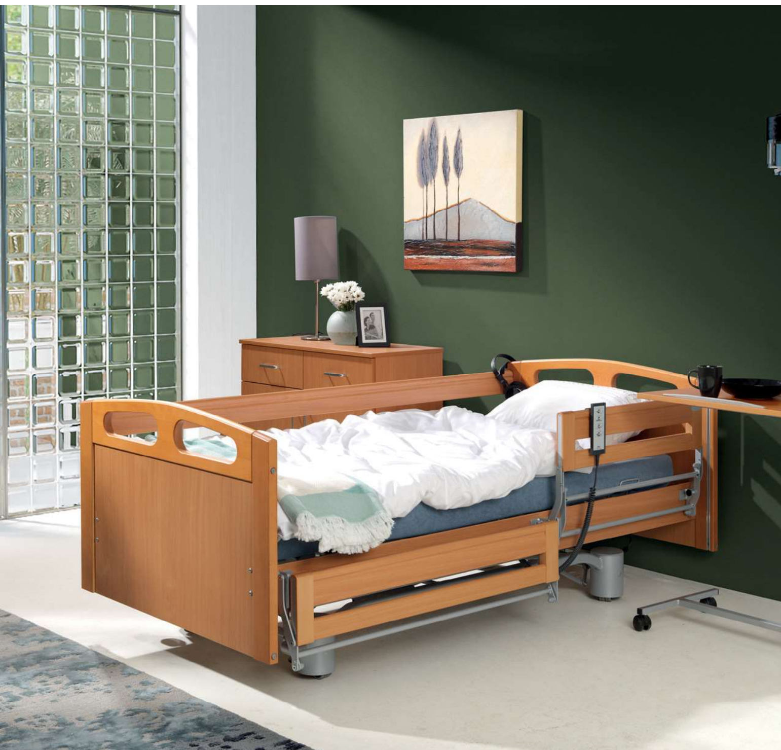
Na zdjęciu: łóżko PB 536 w kolorze buk, z dzielonymi barierkami po jednej stronie łóżka. Akcesoria: Rubens 9 w kolorze buk.

Nowoczesne wzornictwo oraz wielofunkcyjność to dominujące cechy łóżka Elbur PB 536. Zwiększone obciążenie robocze do 200 kg, osłonięte koła jezdne oraz centralny hamulec ułatwiający pracę personelu to sprawdzone rozwiązania stosowane w wielu domach opieki oraz wybierane coraz chętniej przez wymagających klientów indywidualnych.