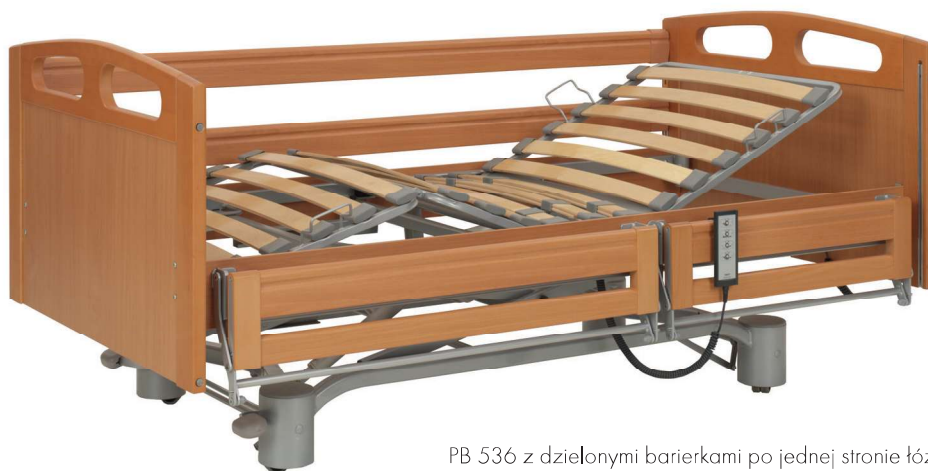
PB 536 z dzielonymi barierkami po jednej stronie łóżka