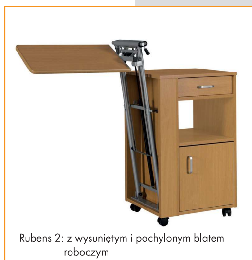
Rubens 2: z wysuniętym i pochylonym blatem roboczym